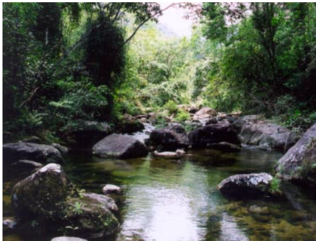
As águas límpidas dependem da vegetação que cresce nas margens dos rios.

A mata beiradeira é considerada Área de Preservação Permanente desde 1965, quando foi criado o Código Florestal, pela Lei Federal n.º 4.771. Apesar dos mecanismos de defesa criados, o grau de devastação das áreas de mata ciliar