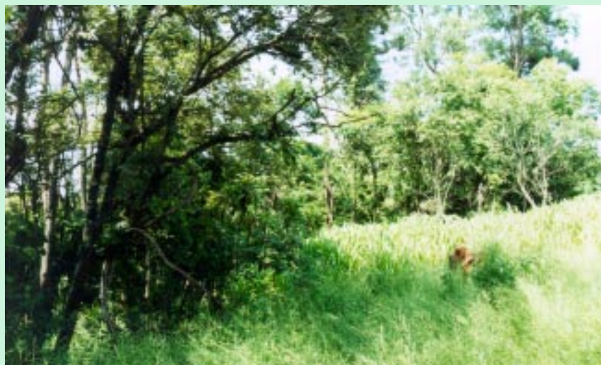
Processo de reflorestamento começa com as espécies pioneiras.

A árvore é um ser vivo, que resultou de uma evolução biológica de aproximadamente 400 milhões de anos. Num ecossistema florestal há árvores de todas as idades e espécies, que crescem uma ao lado das outras, formando basicamente três grupos. As pioneiras, que formam o primeiro grupo, precisam de grande quantidade de luz para germinar e crescer. Sempre em maior quantidade, essas espécies geralmente se desenvolvem com rapidez, são rústicas e produzem muitas sementes, que ficam em repouso até iniciar a germinação. As mais comuns são o açoita-cavalo, aroeira-mansa, capixingui, crindiúva, embaúba,