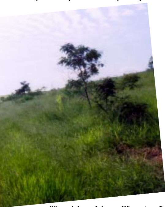
89 espécies arbóreas diferentes vão reflorestar as margens da represa.

À sombra das pioneiras nascem as secundárias, que não suportam a insolação excessiva, apresentando um crescimento moderado. Entre essas espécies incluem-se o angico-branco, angico-vermelho, ipê amarelo, do-brejo e do campo, jatobá, jervá, lixeira, louveira, paineira, pau-ferro, pau-pombo, saboneteira e outras. Finalmente, há as espécies denominadas clímax, mais desenvolvidas, que exigem sombra em boa parte de sua vida e têm um crescimento mais lento. São o palmito, a cabreúva, guarantã, imbuia e óleo-de-copaíba.