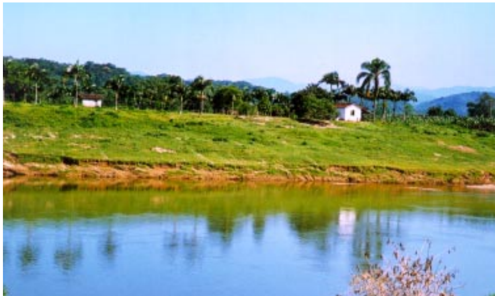
Fundação Florestal está presente em todo o Vale do Ribeira.

Florestal promoveu o repovoamento de mais de 400 hectares de Mata Atlântica com a palmeira juçara ( Euterpe edulis ), envolvendo a comunidade que reside no entorno das unidades de conservação, oferecendo incentivos para a implantação de viveiros e efetuar o plantio das mudas.